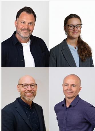
MacMann Berg konsulenter

Direktør, partner og chefkonsulent MacMann Berg – gennemgående underviser.